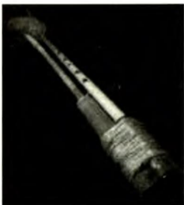
Qo'shnayli avlos musiqa asbobi.

Shuningdek, ibodatxona xarobalaridan bir-biriga ulangan suyaklar birikmasi hamda gilli qotishmalardan yasalgan, puflab chalinadigan sozlar ham topilgan.