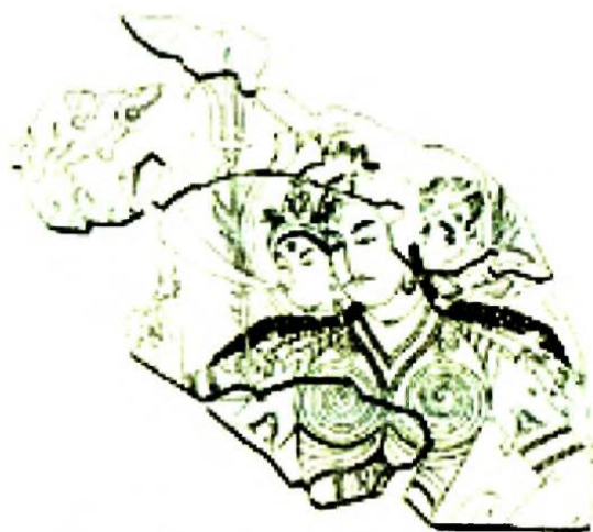
Burg'u puflayotgan malika tasviri. Varaxsha.

Harbiy harakatlar va marosimlar o'tkazilishi davrida ba'zi musiqa asboblari harbiylarning qurol-aslaha, tug', bayroq, tamg'alari qatorida muhim ramziy belgi vazifasini bajargan. Masalan, truba puflama sozi harbiy qo'mondonning alohida ajratish belgisi hisoblansa, idiofon-jom, aerofon-nay kabi musiqa asboblari shohlarning ramziy belgisi sifatida qabul qilingan. Membrafon - ulkan zarbli soz esa lashkarboshilarga topshirilgan. Tabira, charos kabi musiqa asboblari ham qo'shin tarkibidagi harbiylarning lavozimlarini ajratish va belgilashda xizmat qilgan. Panjikentdan topilgan, burg'usimon puflama sozlardan iborat harbiy ansambl va uch boshli, uch ko'zli, olti qo'lli xudoning bo'ynidagi burg'u asbobi ushbu asbobning harbiy musiqa amaliyotida keng qo'llanilganidan dalolat beradi. O'z navbatida burg'u musiqa asbobi muqaddas hisoblangan. "Avesto"da yozilishicha, qattiq qish kelib, barcha tirik jonzotlarning qirilib ketishi xavfi tug'ilganda tangri Ahura Mazda shoh Jamshidga oltin burg'u hadya qiladi. Shoh burg'uga puflanganda yer yorilib, inson va hayvonlar oltin burg'u sadolari ostida Jamshid qurgan yer ostidagi shahar - varlarga kiradilar. Hozirgi Buxoro Navoiy viloyatlari hududlarida Varaxsha, Varzonze, Varozun nomi bilan ataluvchi manzilgohlar borligi ham ushbu hududlar insoniyat beshigi, yuksak madaniyat va ma'naviyat o'chog'i bo'lganligini yana bir karra isbotlaydi.