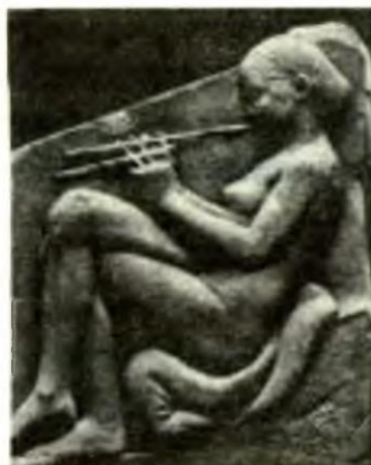
Ushbu asbobni chalayotgan qiz.

Yakka xudolikni targ'ib qiluvchi din sifatida zardushtiylikning vujudga kelishi va asrlar davomida ushbu hududlarda hukmron din mavqeyida unga e'tiqod qilinishi musiqa san'atining tadrijiy rivojlanishi va jarayoniga nihoyatda ulkan ta'sir ko'rsatdi.